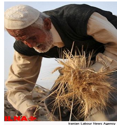
Iranian Labour News Agency

برپایه گزارش خبرگزاری ایلنا، در تاریخ روز یکشنبه ۲۹ اردیبهشت ۹۸ آمده است: جمعی از کشاورزان دهستان چنانه شوش نسبت به عدم پرداخت مطالباتشان از طرف مرکز خرید گلدشت اعتراض کردند. تعدادی از کشاورزان گندمکار دهستان چنانه (واقع در بخش فتح‌المبین شهرستان شوش) به نحوه پیگیری مطالبات گندم تحویل داده‌شان به مرکز خرید گلدشت چنانه اعتراض کردند. بنابراین گزارش، ۱۱ مرکز خرید در شهرستان شوش هستند که هشت تای آنها زیر نظر تعاون روستایی می‌باشند و سه مرکز دیگر زیر نظر شرکت غله و خدمات بازرگانی .وی با تاکید بر اینکه شرکت غله، نهادی است که مجوز مراکز خرید را صادر می‌کند، گفت: از میان نهادهای معرفی‌شده، دو مرکز از سوی شرکت غله برای دریافت گندم مجوز دریافت نکرده‌اند؛ یکی گلدشت چنانه و دیگری رحیم‌خانی .... این دو مرکز با دریافت گندم