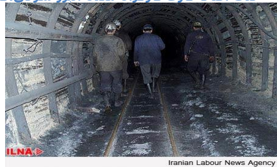
Iranian Labour News Agency

به گزارش خبرنگار ایلنا، در سیزدهم تیر 97 آمده است: بیش از ۷۰۰ کارگر شاغل در معدن زغال سنگ البرز شرقی از حذف مزایای اضافه کاری و تعطیل کاری خود در سه ماه گذشته خبر می دهند. کارگران شاغل در معدن زغال سنگ البرز شرقی می گویند: از سه ماه پیش کارفرما، مزایای اضافه کاری و تعطیل کاری کارگران را به بهانه کاهش هزینه ها حذف کرده است. به گفته آنها، با حذف اضافه کاری از حقوق هر یک از کارگران معدن البرز شرقی؛ حدود ۵۰۰ هزار تا یک میلیون تومان کسر شده است. کارگران مدعی هستند که تنها ۵۰ درصد از مزایای آخرین اضافه کاری آنها از سوی کارفرما همزمان با حقوق خرداد ماه پرداخت خواهد شد. کارگران معدن البرز شرقی می گویند: دلیل حذف اضافه کاری و تعطیل کاری آنها به کارگیری نیروی جدید کار به بهانه توسعه اشتغال در منطقه است... کارگران البرز شرقی اعتقاد دارند که درآمد فعلی مخارج زندگی خانوادهايشان را تامین نمی کند. آنها تاکید دارند که با حذف اضافه کاری و تعطیل کاری ها برای تامین مخارج زندگی دچار مشکل شده اند