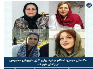
۲۰ سال حبس، احکام جدید برای ۴ زن درویش محبوس در زندان قرچک

به گزارش #مجنوبان نور؛ احکام صادره در #دادگاه انقلاب به ریاست قاضی احمدزاده برای چهار زن درویش محبوس در زندان قرچک ابلاغ شد.